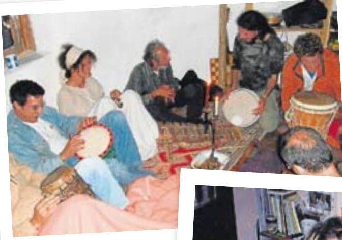
LA NOCHE La música y las velas acompañan la captación de nuevos miembros tras la caída del sol.