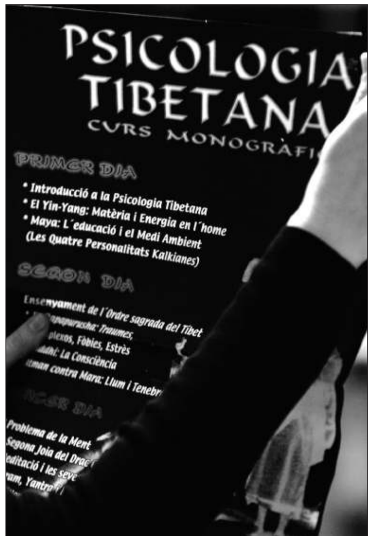
El cartell de les jornades que va organitzar el CEA a Andorra. F. G.